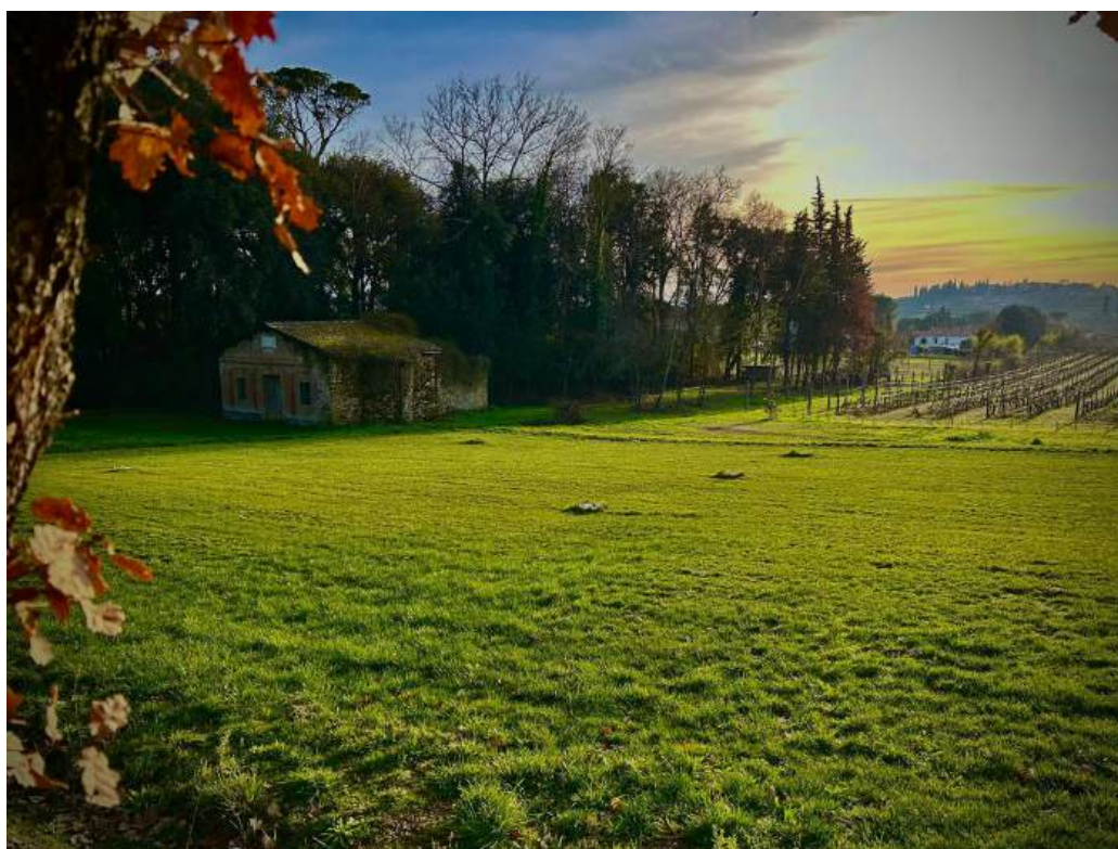
I luoghi del Badalischio.