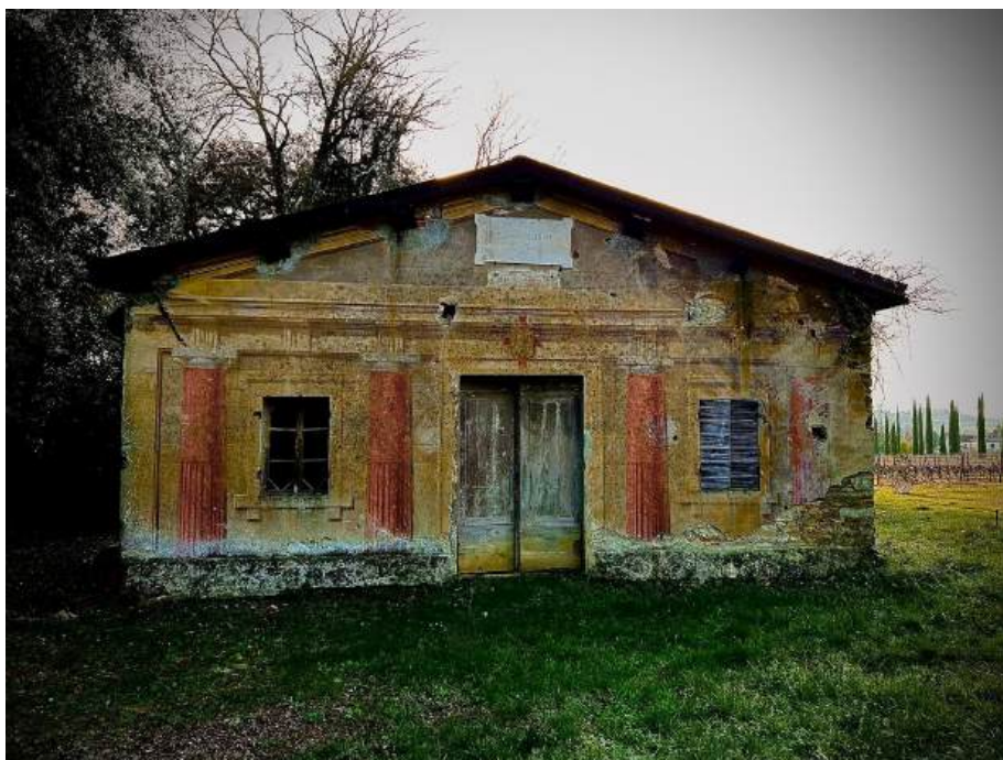
La rimessa della Villa Guillichini dove la marchesa faceva scuola ai figli dei suoi mezzadri

Dicono infatti alcune leggende di un passato lontano, che il mitico animale, in questa forma grossa e tozza, potrebbe occasionalmente essere il risultato di una mutazione di un normale serpente a cui appunto sia stata mozzata la coda. Il derivato non solo acquisterebbe dimensioni gigantesche, ma guadagnerebbe, in cambio della mutilazione prodotta, intenzionale o accidentale che sia, doti straordinarie di affezioni quasi intelligenti al luogo di appartenenza, e una lunghissima durata della vita. Finché a qualcuno non venga in mente di cancellarne le tracce e la memoria.