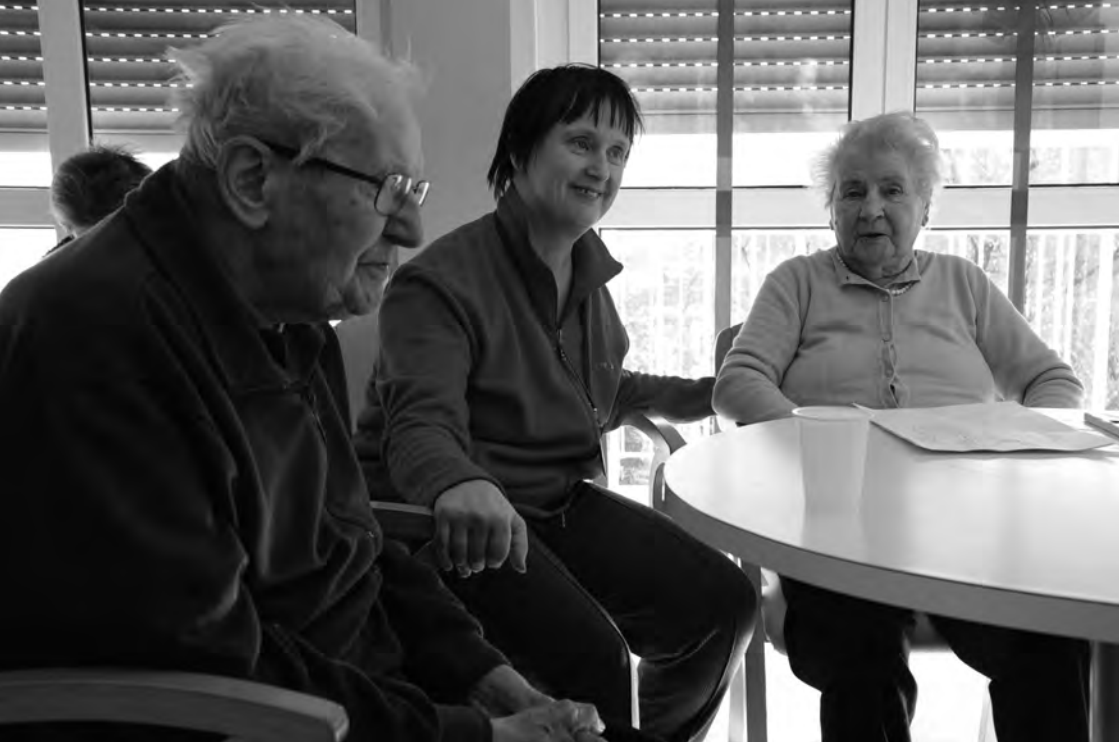
Foto scattate nella Fondazione Centro Residenziale Menotti Bassani, 2019