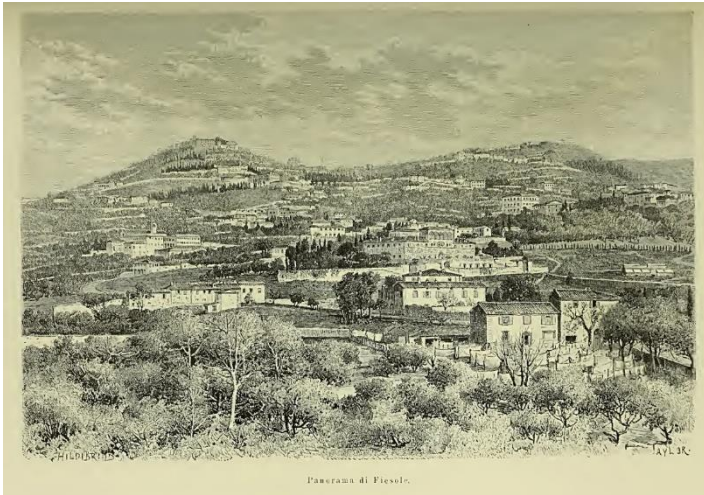
Panorama di Fiesole.

Per questi motivi e per mille altri ancora la amo.