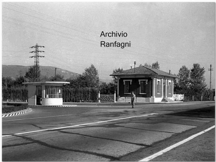
Casello dell'autostrada Firenze-Mare al Soccorso.

L'autostrada iniziata nel 1928/1929 fu aperta al traffico nel tratto Firenze Montecatini nel 1932.