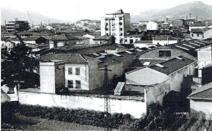
vista dal palazzo Magnolfi - foto eredi Magnolfi dedicata a Ferdinando

Il mio disegno per l'esame di terza media fu un paesaggio urbano. I palazzi in costruzione in via Siena al tramonto, con un gran sole ed una gru! La mia scelta era fatta anche se non lo sapevo.