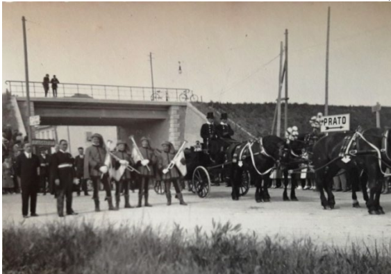
Ponte Autostrada al Soccorso 1934