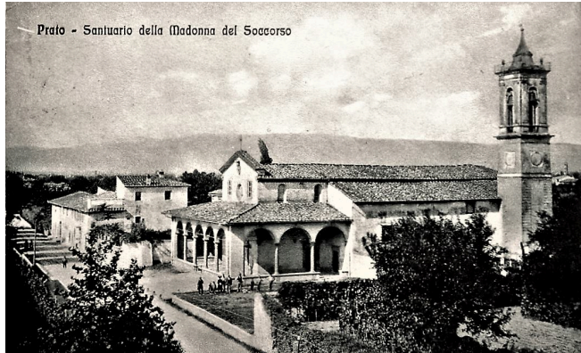
Dalla pagina fb La Vecchia Prato

In via Roma le case solo da un lato, tanti campi, la Chiesa e il Camposanto, il ponte dell'autostrada e poi fino al Puggelli fornaio non c'era nulla.