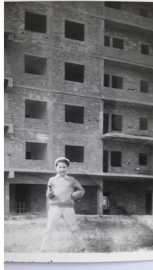
Bambini anni '60