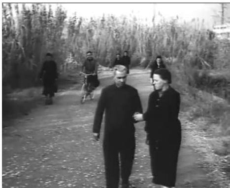
fotogramma dal film "Giovanna" di G. Pontecorvo 1955

Nei giardini prima si vedeva giocare solo a pallone ora giocano anche con delle palette in legno. (cricket)