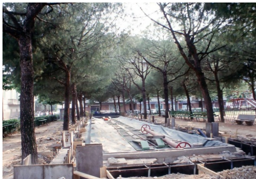
il pallaio in costruzione