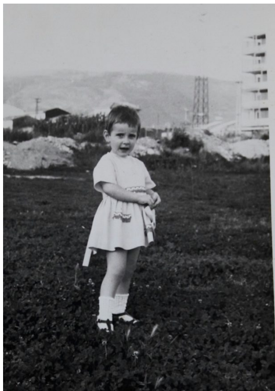
I giardini di via Marx anni '60

la gelateria o meglio la latteria perché di questo si tratta; è su via K. Marx passato l'incrocio con via Siena. Ha pochi gusti, come le gelaterie di allora, semplici ma buoni in particolare l'amarena. Ho avuto un vero e proprio imprinting su quel gelato e inconsciamente lo cerco tutte le volte che ne assaggio uno nuovo. Le scelte erano coppetta o cono da £ 30, 50 o 100; quello da 100 aveva il cono biscottato. Provo ad indovinare: da 30 £, perché altrimenti mi rovino il desinare, cioccolato e amarena, preparati da poco. Esco con il mio cono e la giornata comincia a sorridermi.