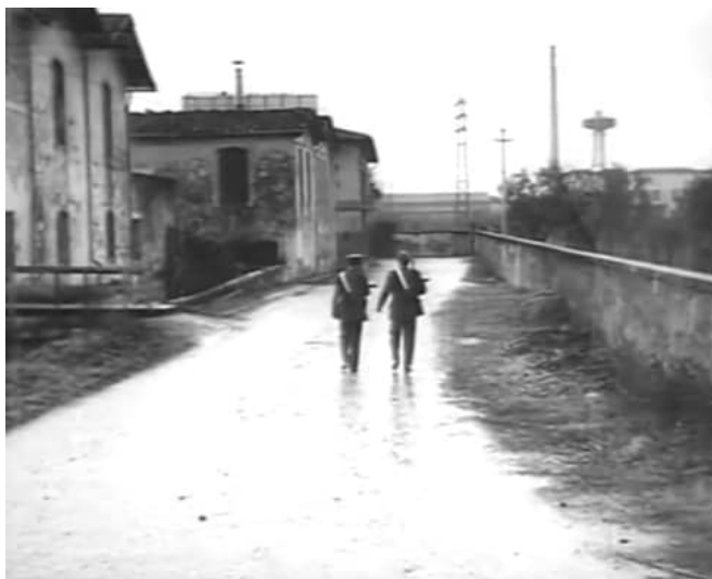
fotogramma dal film "Giovanna" di G. Pontecorvo 1955

*Con il termine Romita, in uso anche oggi, si indicava già nel XIV secolo, una parte del sobborgo fuori Porta Santa Trinita compresa fra il Soccorso e le mura trecentesche. Da questo toponimo presero il nome la gora che lo attraversava, il tabernacolo posto all'incrocio tra via M. Roncioni e via Roma, dipinto del 1418 da Pietro e Antonio Miniati, comunemente detto oggi Madonna del Berti, e il... mulino posto sull'omonima via. Nel Novecento, inserito in un'area a forte sviluppo industriale, l'opificio verrà trasformato in una follatura e un purgo che continueranno a utilizzare l'acqua." Gore e mulini della piana pratese. Territorio e architettura." Giuliano Guarducci e Roberto Melani – ed. Pentalinea