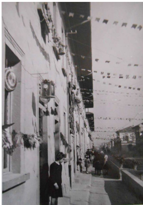
via A. Zarini in festa

speranzosi, noi ragazzi ci mettevamo a sedere sui pilastri che sbarravano via Pacchiani, proprio alla confluenza con via Roma e diligentemente annotavamo i numeri delle targhe delle rare auto che ci passavano davanti (sarebbe pensabile oggi una simile contemplazione dei veicoli, una specie di adorazione magica, nello sfrecciare ossessionante dei motori!?). Allora invece il traffico automobilistico era talmente limitato che si aveva tutto il tempo di trascrivere la targa e sognare la bicicletta, che, a quanto ricordo, nessuno vinse ( ma forse l'idea del concorso fu una invenzione fantasiosa, una bufala messa in circolazione da chissà chi! ). Succedeva anche questo nella zona del Soccorso, quando i giardini di via Carlo Marx erano un campo attraversato dalle gore.