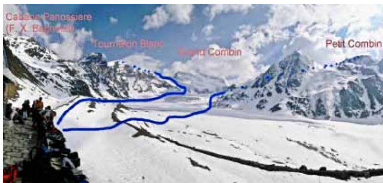
Vista del ghiacciaio dalla Cabane de Panossière (sulla sinistra).

Superammo, lasciandola sulla nostra sinistra, la seraccata coi suoi rumori sordi, proseguimmo soli e spediti fino al colle. Lì, i primi raggi del mattino colpendo di striscio i cristalli di neve li facevano brillare: camminavamo come fra i brillanti di qualche lussuoso negozio del centro e la montagna era avvolta in un manto luccicante come una bella signora nel foyer della Scala, tanto luccicante da abbagliare.