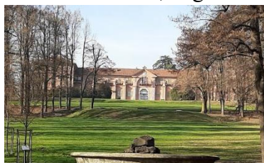
LA MANDRIA (uno scorcio)

Montiamo in sella ai nostri bolidi e partiamo velocissimi, destinazione parco LA MANDRIA, ma non demordiamo, la gita alla Reggia è solo rimandata.