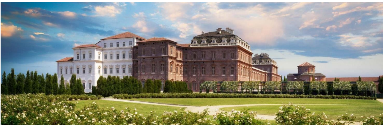
FANTASTICA REGGIA DI VENARIA